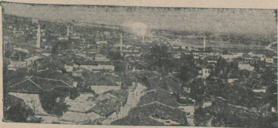
Şair Eşrefin mezarı bulunduğu Kırkçağdan umut bir manzara...