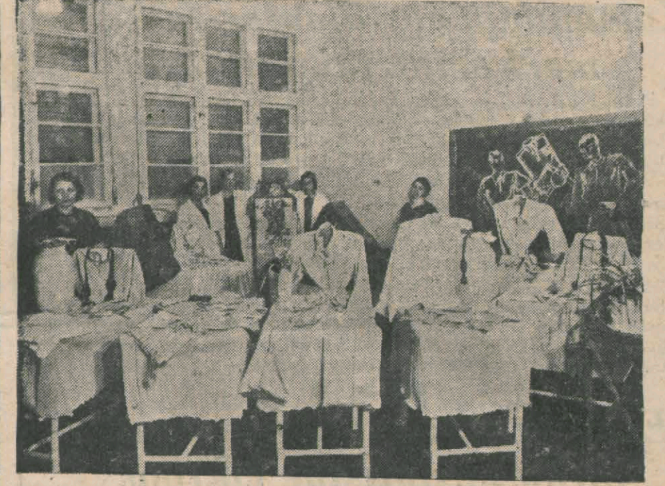
Enstitünün vücutta getirdiği eserleri teşhir eden bir salon