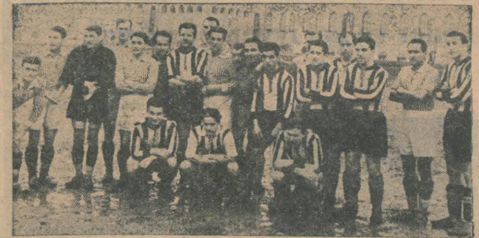
Dünkü maçtan evvel B.J.K. - G. S. muhtelitti C.F.R. takımına beraber

Bugün Romen takımını behemehal yenmeliyiz