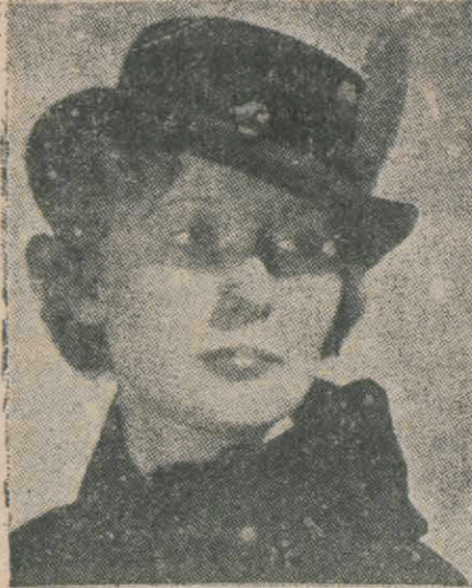
Delikanlığı dava eden güzel dul kadın..

Delikanlı fazla sarhoş olduğundan evini ve yatağını şaşırması